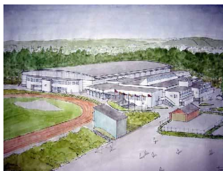
Oppsal Arena med hall og utendørsanlegg.