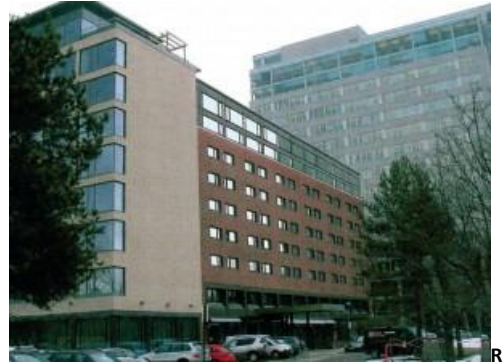
Rica Hotell Helsfyr.

UBMs spillerhotell vil være Rica Hotell Helsfyr, der det vil bli reservert rom til deltakere med ledere og foreldre. Vi har mottatt et fordelaktig pristilbud for overnatting, men dette hotellet er først og fremst valgt på grunn av dets beliggenhet utenfor sentrum ved et av Oslos knutepunkter for offentlig kommunikasjon. Her stopper flybussen til/fra Gardermoen hvert 20. minutt og det er T-baneforbindelse med Oslo sentrum og Oslo S hvert 4. minutt. Videre er det to taxiholdeplasser på stedet, og to T-banelinjer og én busslinje kan brukes for transport mellom hotellet og Oppsal Arena.